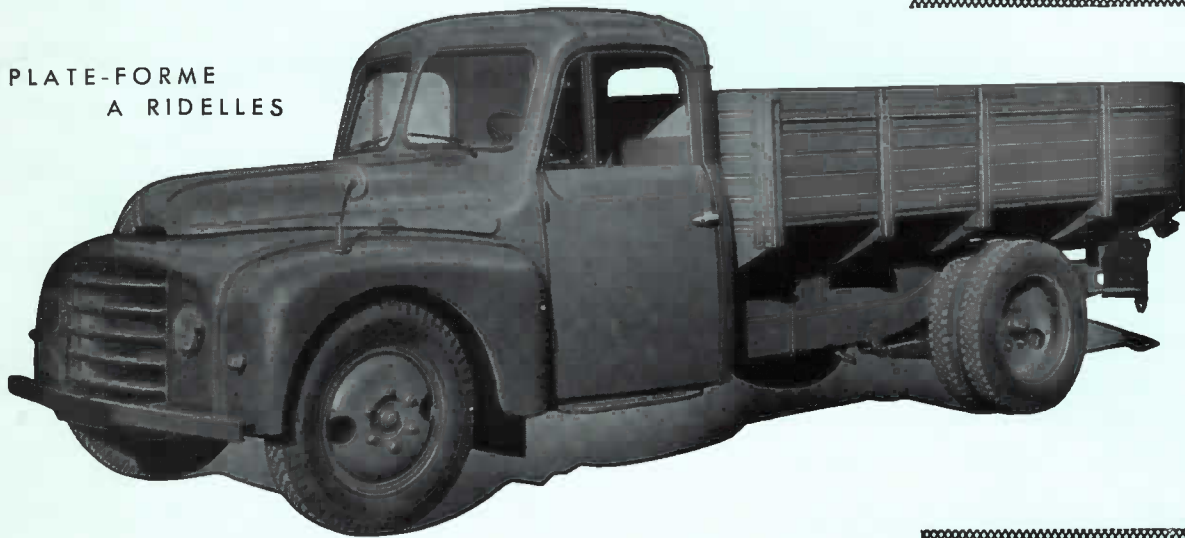
PLATE-FORME A RIDELLES