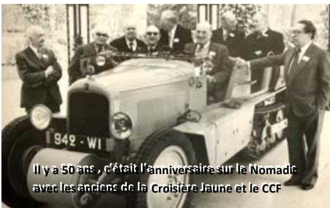
Il y a 50 ans, c'était l'anniversaire sur le Nomadic avec les anciens de la Croisière Jaune et le CCF

Une petite quinzaine de Citroën Kégresse, retraçant l'évolution des chenilles, de la B2 K1 à la P19.