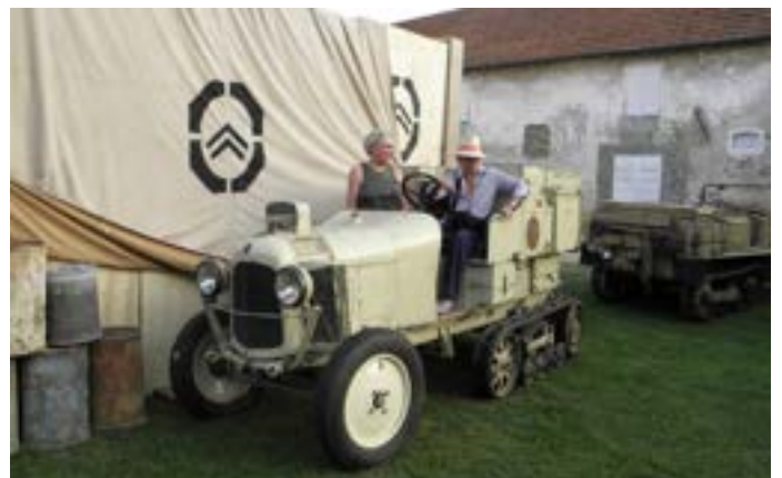
Pour l'occasion, l'authentique B2 Scarabée-d'Or, ainsi que la réplique P17 de la Croisière Jaune s'étaient échappées du Conservatoire Citroën, pour cette journée commémorative.