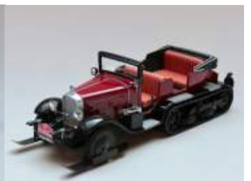
A. Kobylko C6 P15 N « Monte Carlo 1934 »