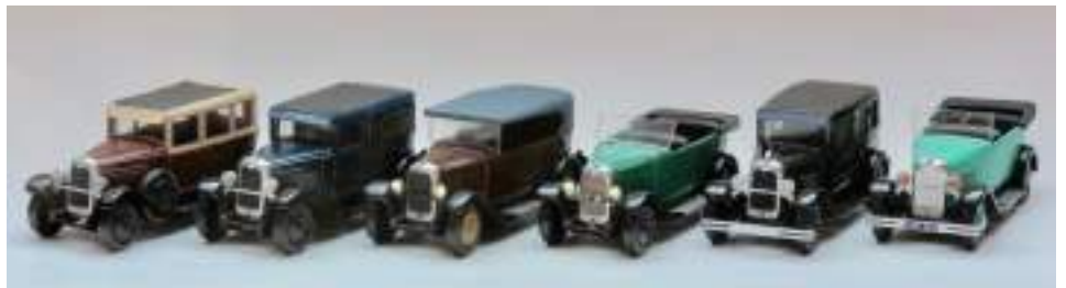
Jean-Marie Dubray a été très prolifique en matière de C4.

J'ai donc cherché à "boucher" les trous par des productions artisanales de plus ou moins belles factures mais, qui ont le mérite d'exister.