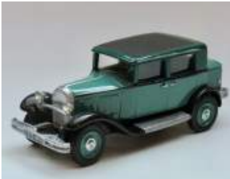
SVM Berline C6F CGL