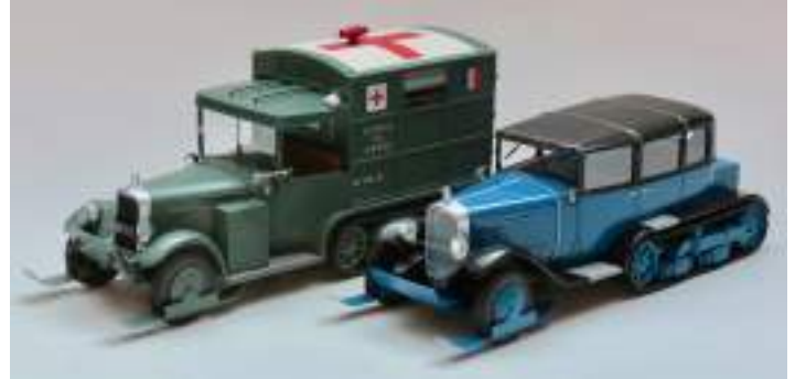
A. Kobylko : Limousine C6 Lictoria Sex, Coupé de ville C6E, Ambulance C6 P15 N et Conduite intérieure C6 P15 N du Patron