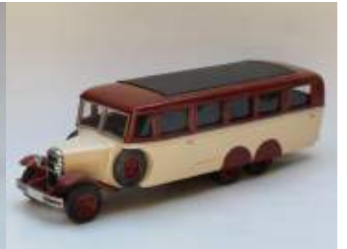
MAP C6G Car 3,5 T Double essieu arrière