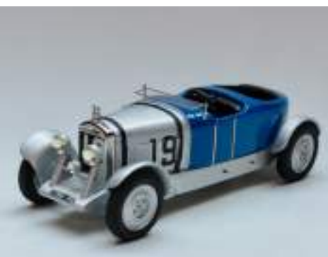
SLM 43 C4 « Le Mans 1932 »