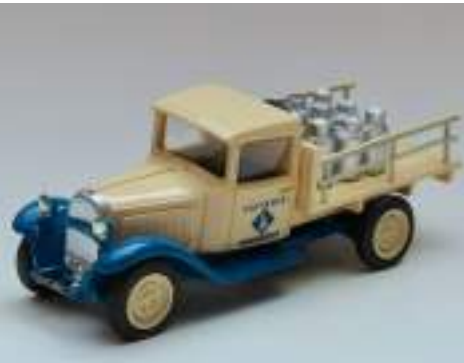
Transpub Plateau laitier C6 I 1.800 Kg.