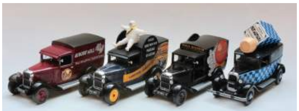
IXO a réalisé presque exclusivement des utilitaires.

Dès leur sortie, les Citroën C4 et C6, présentées au Salon de Paris de 1928, seront produites par les Jouets Citroën jusqu'en 1932. Très modernes pour l'époque, elles représentent deux des Citroën importantes dans l'histoire de la marque. Déclinées dans de nombreuses versions, des berlines aux camionnettes en passant par les cabriolets, la gamme C4 et C6 va être reproduite en jouet aux 1/10e et 1/15e. Certaines voitures possédant de véritables pneus, des MICHELIN, des phares électriques, moteur mécanique et capote en toile.