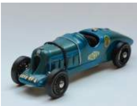
Techni-France C6G « Rosalie II des records »