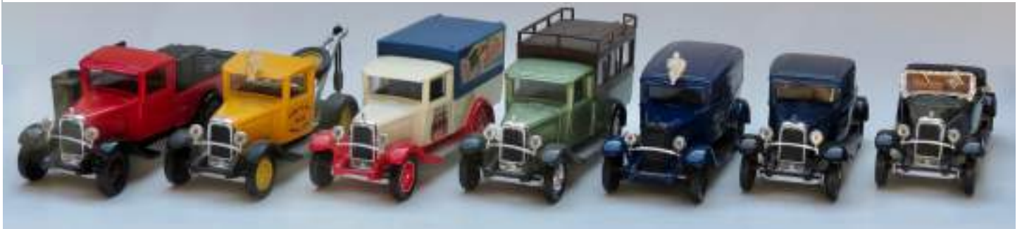
Quelques modèles Solido parmi les centaines de variantes produites.

En 2018, on a fêté les 70 ans de la 2 CV et les 50 ans de la Méhari et, cela n'était que dans l'ordre des choses. Cependant, deux modèles qui ont bien servi la Marque au double chevron auraient mérité qu'on n'oublie pas leur anniversaire.